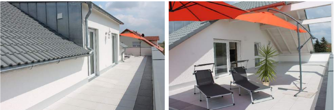
Terrasse (100 m 2 ):