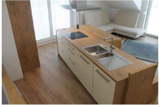
Wohnen (Anteil von 35 m 2 ):